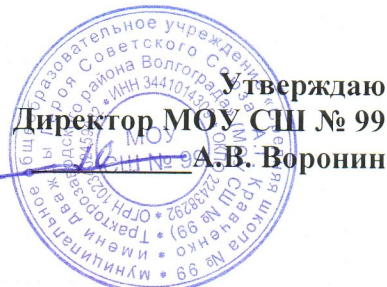
График работы Школьного спортивного клуба «Олимпийцы» на 2023-2024 учебный год.